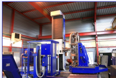
Aléuseuse 5 axes