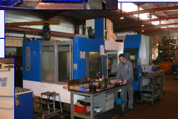
Centre d'usinage UGV