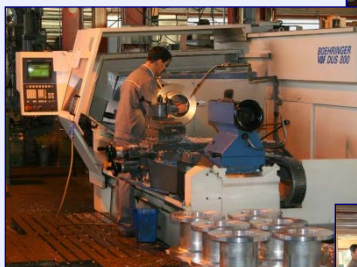
Tour 3 axes